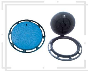
انواع دریچه منهول در سایز و اوزان مختلف