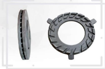
دیسک انواع خودرو