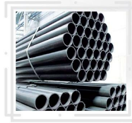
انواع لوله های داربست در سایز و اوزان مختلف

Types of Scaffolding Pipes in Different Sizes & Weights