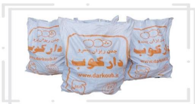
بسته بندی مناسب