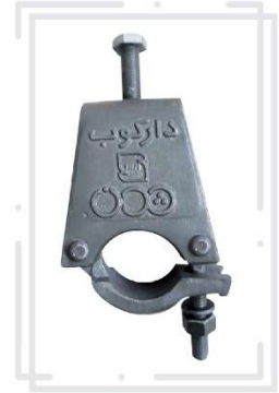
بست تیر آهنی