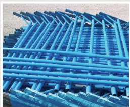
جک داربستی در سایز و اوزان مختلف

Scaffolding Jacks in Different Sizes & Weights