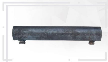
اتصال ۲۰ سانت ورق ۲.۵

Connection of 20 cm Sheet, 2.5 Scaffolding