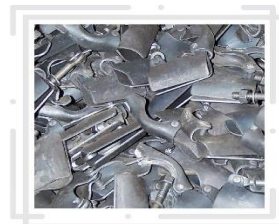
بست تک پیچ