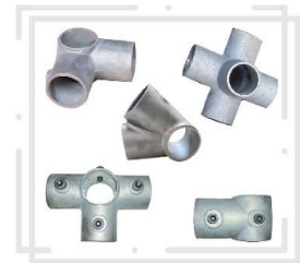
نسل جدید اتصالات داربست

The New Generation of Scaffolding Connections