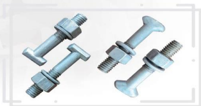
پیچ ، مهره و واشر