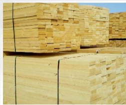
تخته زیربانی داربست در سایزهای مختلف