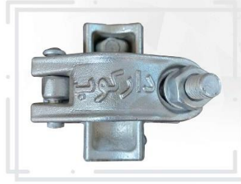
بست دو پیچ