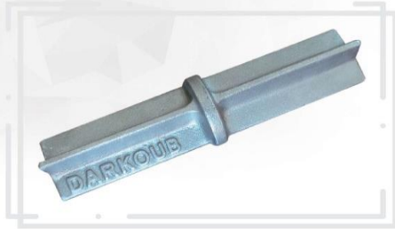
مغزی ( پین ) داربست